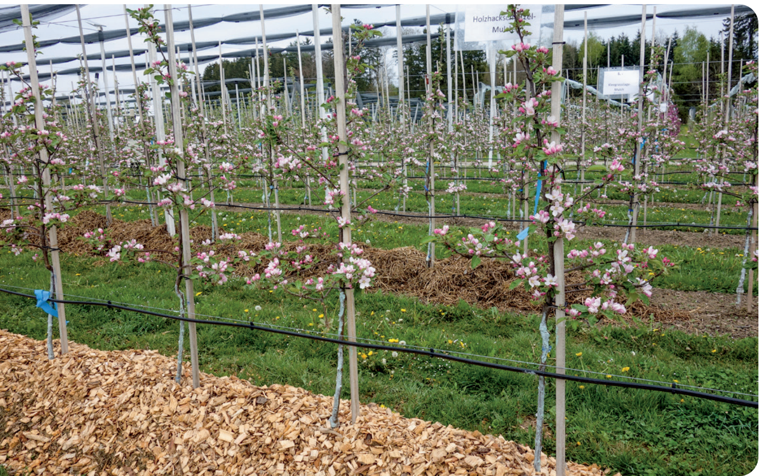
DIE AUFLAGE VON Holz hackschnitzeln und Klee grassilage im Baumstreifen ermöglicht eine Erhöhung der Bodenfeuchte. Als zusätzlicher Effekt dienen die Materialien der Beikrautunterdrückung.