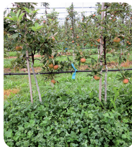
RECHTS: NIEDRIG WACHSENDE Kleeernte im Baumstreifen, bestehend aus Weiß-, Horn-, Erd- und Wundklee.

befinden sich noch im Versuchsstadium und sind noch nicht praxisreif.