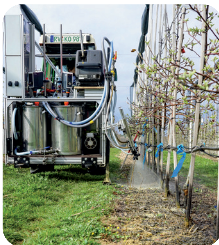
LINKS: PROTOTYP FÜR die Applikation des aufspritzbaren Mulchmaterials aus nachwachsenden Rohstoffen, entwickelt vom Technologie- und Förderzentrum Straubing.

Der Versuchsaufbau bei den Mulchmaterialien umfasste Kleeegrassilage, Holzhackschnitzel, zwei verschiedene Untersaaten und einen biologisch abbaubaren Sprühmulch. Als Kontrolle diente ein nach integrierter Produktion mit Herbizid freigehaltener Baumstreifen. Der Versuch wurde in einer Elstar PCP-Anlage durchgeführt, die im Winter 2019 mit einem Abstand von 0,8 x 3,20 m gepflanzt wurde. Vor der Ausbringung der Materialien Anfang April wurde der Baumstreifen mit einem Ladurner-Hackgerät gekrümelt. Die Kleeegrassilage und die Holzhackschnitzel wurden mit einer Höhe von 15 cm im Baumstreifen ausgebracht. Die Holzhackschnitzel bestanden aus 60 Prozent Nadel- und 40 Prozent Laubholz und hatten ein hohes Kohlenstoff-Stickstoff-Verhältnis (C/N). Deshalb wurde im Etablierungsjahr eine Ausgleichsdüngung von 1,0 g N pro m 2 und cm Mulchschicht unter die Hackschnitzel gegeben. Diese verhindert, dass Mikroorganismen im Boden beim Abbau des hohen Kohlenstoffanteils aus dem Holzhäcksel mit dem Apfelbaum um Stickstoff konkurrieren. Die beiden Untersaaten bestanden aus Mischungen mit höher beziehungsweise niedriger wachsenden Kleesorten. Sie wurden Anfang bis Mitte April ausgesät. Der Sprühmulch wurde vom Technologie- und Förderzentrum Straubing (TFZ) als aufspritzbares Abdeckmaterial auf Basis von Maisstärke und Rapsöl entwickelt. Das Material sowie der Prototyp zur Applikation