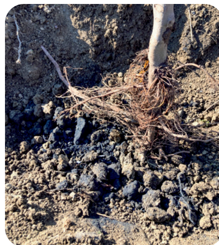
EINARBEITUNG VON PFLANZENKOHLE als Bodenzuschlagsstoff ins Pflanzloch.

Durch keinen der verwendeten Bodenzuschlagsstoffe wurde in den Jahren 2021 und 2022 eine höhere Bodenfeuchte erzielt. Lediglich die betriebsübliche Variante mit Bewässerung und Kompostauflage erzielte einen deutlich höheren Wassergehalt im Vergleich zur Nullvariante ohne Bewässerung. Trotz der geringen Unterschiede bezüglich der Bodenfeuchte wurde Ende 2021 ein signifikant stärkerer Triebzuwachs in den Parzellen mit Gesteinsmehl und dem Kohle-Kompost-Gemisch im Vergleich zur Nullvariante gemessen. Da keine Unterschiede in der Wasserversorgung der Bäume nachgewiesen wurden, könnte eine verbesserte Nährstoffversorgung zu einem stärkeren Wachstum geführt haben, was Blattanalysen aber nicht bestätigten. Insgesamt hängt die Wirkung von Bodenzuschlagsstoffen auf den Bodenwasservorrat von der eingebrachten Produktmenge ab. Um die Wirksamkeit eines Produktes einzuschätzen, ist es ratsam, beim Hersteller die potenzielle Wasserspeicherung zu erfragen.