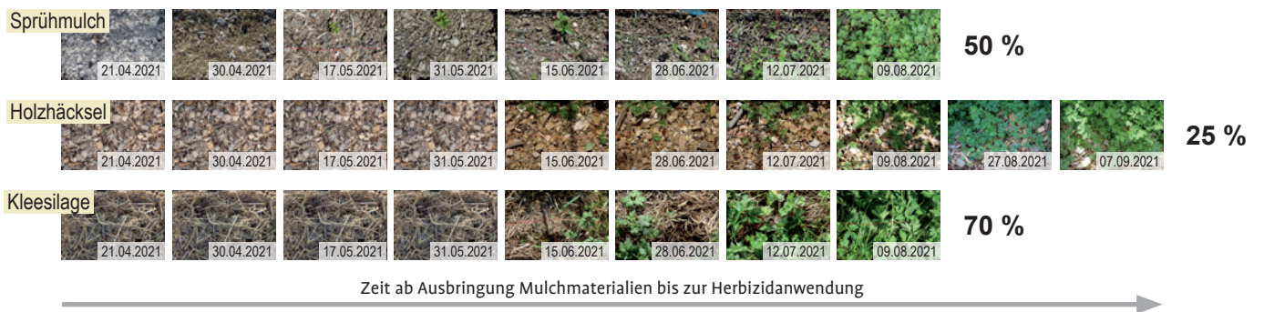
AUSWERTUNG DES BEIKRAUTBEWUCHSES von der Ausbringung dreier Mulchmaterialien bis zur Herbizidspritzung bei einem Bewuchs von mehr als 50 Prozent. Grafik: Haug

Die Bodenuntersuchungen ergaben, dass insbesondere durch die Kleeegrassilage hohe Mengen an Kalium (+80 Prozent), Phosphor (+50 Prozent) und mineralisiertem Stickstoff (Nmin) (+18 Prozent) in den Boden eingetragen wurden. Alle anderen Varianten beeinflussten den Gehalt an Kalium und Phosphor kaum. Der Nmin-Gehalt war im Herbst unter der Holzhäcksel-Auflage am geringsten (24,7 kg/ha), gefolgt vom Sprühmulch (36,7 kg/ha), den Klee-Untersaaten (rund 50 kg/ha), der Kontrolle (140 kg/ha) und der Kleeegrassilage-