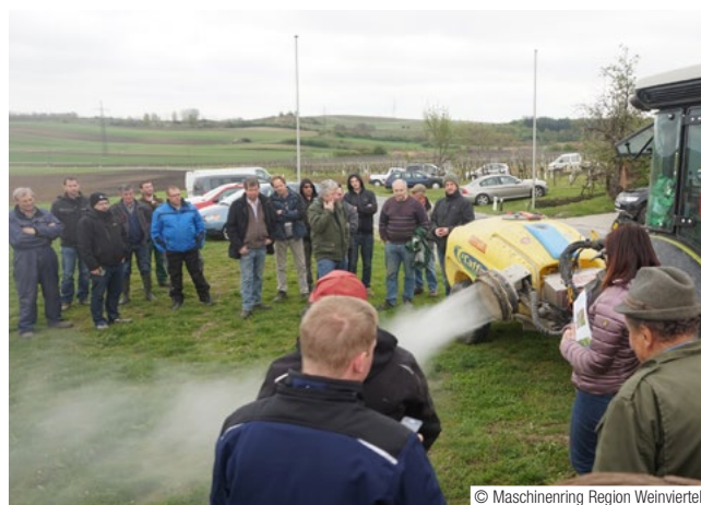
Abb. 6: Der Grasskiller bei einer Vorführung des Maschinerrings im Weinviertel: Das Gerät arbeitet mit kaltem Wasser und Hochdruck. Der Wasserverbrauch liegt zwischen 900 und 1.300 Liter pro Hektar