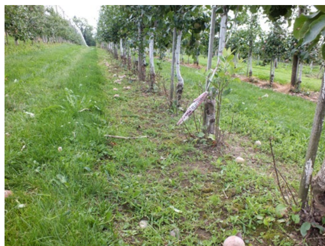
Abb. 3: Herbizid + Fadengerät – durch das Fadengerät ist ein permanenter Bedeckungsgrad gegeben