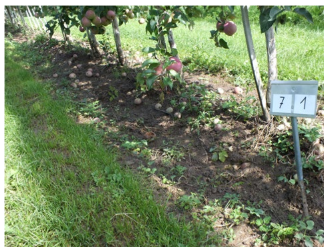
Abb. 4: Herbizid + Rollhacke mit Fingerhacke – Dammbildung durch die Fingerhacke im Zwischenstammbereich