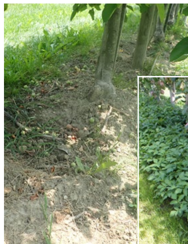
Abb. 5: links: Vorox + 6 Beloukha Mitte April appliziert, Foto Anfang Juli; rechts: Pelargonsäure zeigt bei später Anwendung keine ausreichende Wirkung

Ob die gewählte Methode für diese Fragestellung zu ungenau ist oder tatsächlich die Verfahren keinen Einfluss auf das mikrobielle Bodenleben hatten, konnte nicht geklärt werden. Um einzelne Verfahren der Beikrautregulierung hinsichtlich ihrer Auswirkungen auf das Bodenleben zu bewerten, ist es zukünftig notwendig, ein breiteres Spektrum der Bodenfauna, wie z. B. bodenbrütende Insekten im Baumstreifen, genauer zu betrachten.