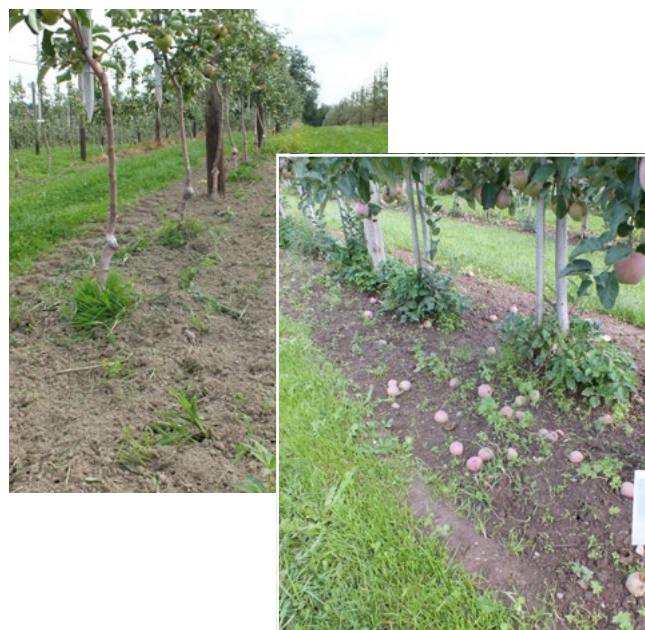
Abb. 2: Krümler – gute Regulierung + sauberer Abschluss zur Fahrgasse; etablierte Beikrauthorste im stammnahen Bereich werden durch den Krümler (ganzjährig) nicht optimal erfasst (rechts)

Mit Pelargonsäure statt Glyphosat konnte keine ausreichende Bekämpfung erzielt werden. Der Baumstreifen war hier z. T. vollständig bedeckt und die Wuchshöhe der Beikräuter erreichte über 30 cm. Zudem zeigte sich, dass die Pelargonsäure hauptsächlich gegen zweikeimblättrige Arten und dort vor allem im Jugendstadium der Beikräuter wirkt. Schwer bekämpfbare Arten wie z. B. der Giersch oder die Einjährige Risppe konnten mit Pelargonsäure nicht aus-