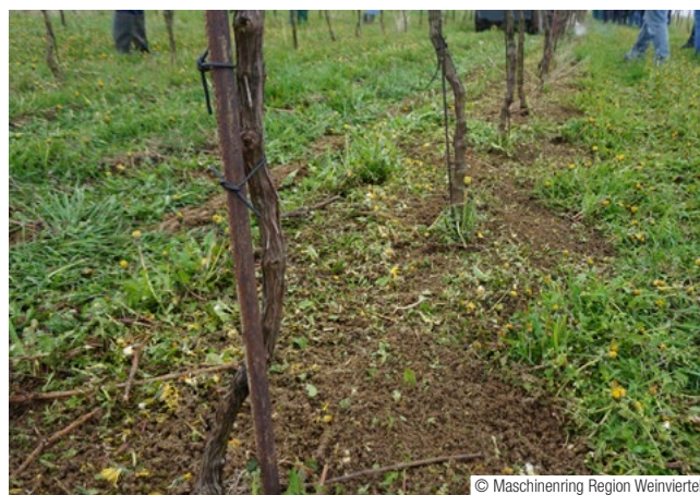
Abb. 7: Mittels spezieller Düsen auf einem rotierenden Kopf wird das Wasser mit ca. 1.000 bar in den Boden gespritzt und zerstört somit die Beikräuter und deren Wurzel bis in 5 cm Tiefe